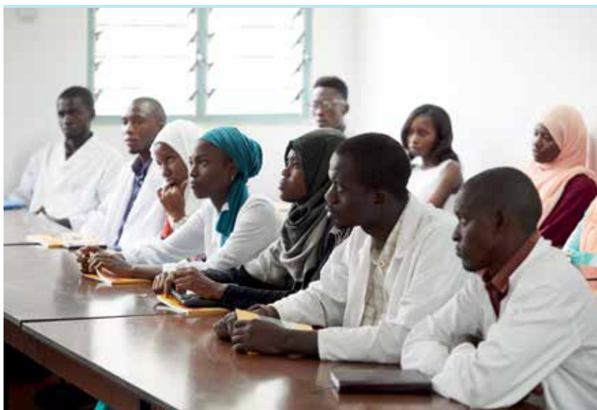
Sessions de formació a professionals de la salut.

problemes durant el part tant per a la mare com per al nadó. Tot i així, a les comunitats que es practica es percep com una important tradició i part de la seva cultura, sostinguda per creences al voltant dels beneficis d'aquesta pràctica en qüestions d'estètica, higiene, protecció de la virginitat, puresa espiritual, etc. Tant és així que s'estima que el 65% de les noies i dones entre 15 i 49 anys a Gàmbia creuen que la pràctica s'ha de mantenir 5 .